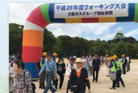
▲ウォーキング大会